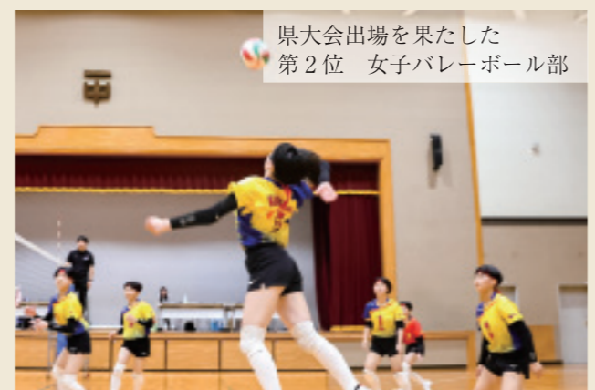
県大会出場を果たした第2位 女子バレーボール部