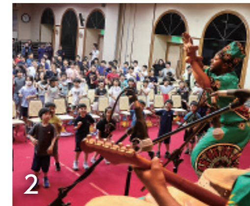
1_多彩な音楽と歌声で会場を盛り上げた「リンゴマ」の皆さん 2_音楽で一体になった会場では心と体が沸き立つ児童の姿が見られました