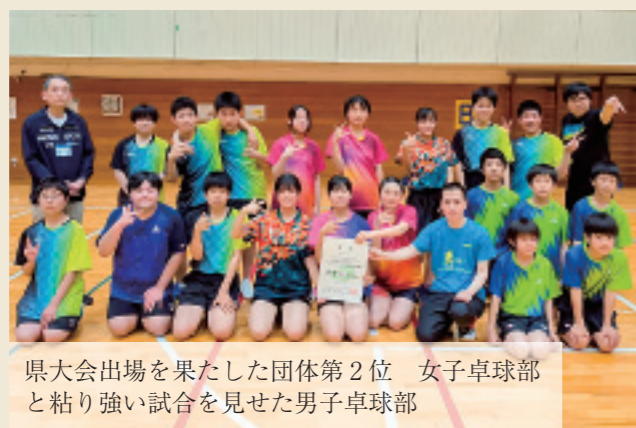
県大会出場を果たした団体第2位 女子卓球部と粘り強い試合を見せた男子卓球部