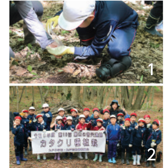
1_きれいに開花することを願って植栽 2_元気にいっぱい自然を堪能しました