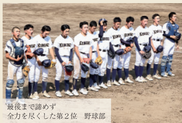
最後まで諦めず全力を尽くした第2位 野球部