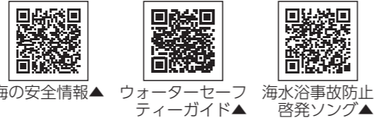
海の安全情報▲ ウォーターセーフティガイド▲ 海水浴事故防止啓発ソング▲

海水浴をする際は、監視員やライフセーバーがいる時間帯の開設された海水浴場で安全に海水浴を楽しみましょう。また、フロート遊具や浮き輪を使っていて、思いがけず沖に流されることがあります。保護者は常に子どもから離れないようにしましょう。加えて、海岸で大きな揺れを感じたら・津波警報を知らせる放送やサイレンを聞いたら速やかな避難！津波警報が解除されるまで避難を継続しましょう。