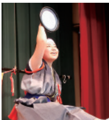
神楽甲子園では精一杯演舞します。ご声援お願いします