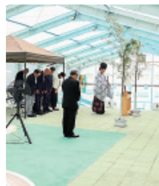
利用される皆さまの安全を祈願しました（次号掲載）

暑さの厳しくなるこれからの季節、水泳は涼を得るだけでなく、体力づくりや健康維持にも最適です。お子さまから高齢の方まで、ぜひご家族やご友人と足を運び、爽やかな汗を流していただきたいと思っております。利用の際には、ルールを守り、安全に配慮して楽しいひとときをお過ごしください。今シーズンも皆さまのご来場を心よりお待ちしております。