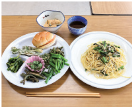
皆さんで協力して調理した、山菜盛りだくさんの昼食