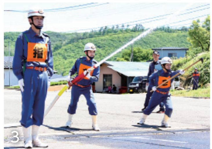
1 早朝から村内15分団が集結し、日頃の練習の成果を競い合いました 2・3 第二分団によるポンプ車操法と第九分団による小型ポンプ操法では連携のとれた素早い動きと正確性が光りました