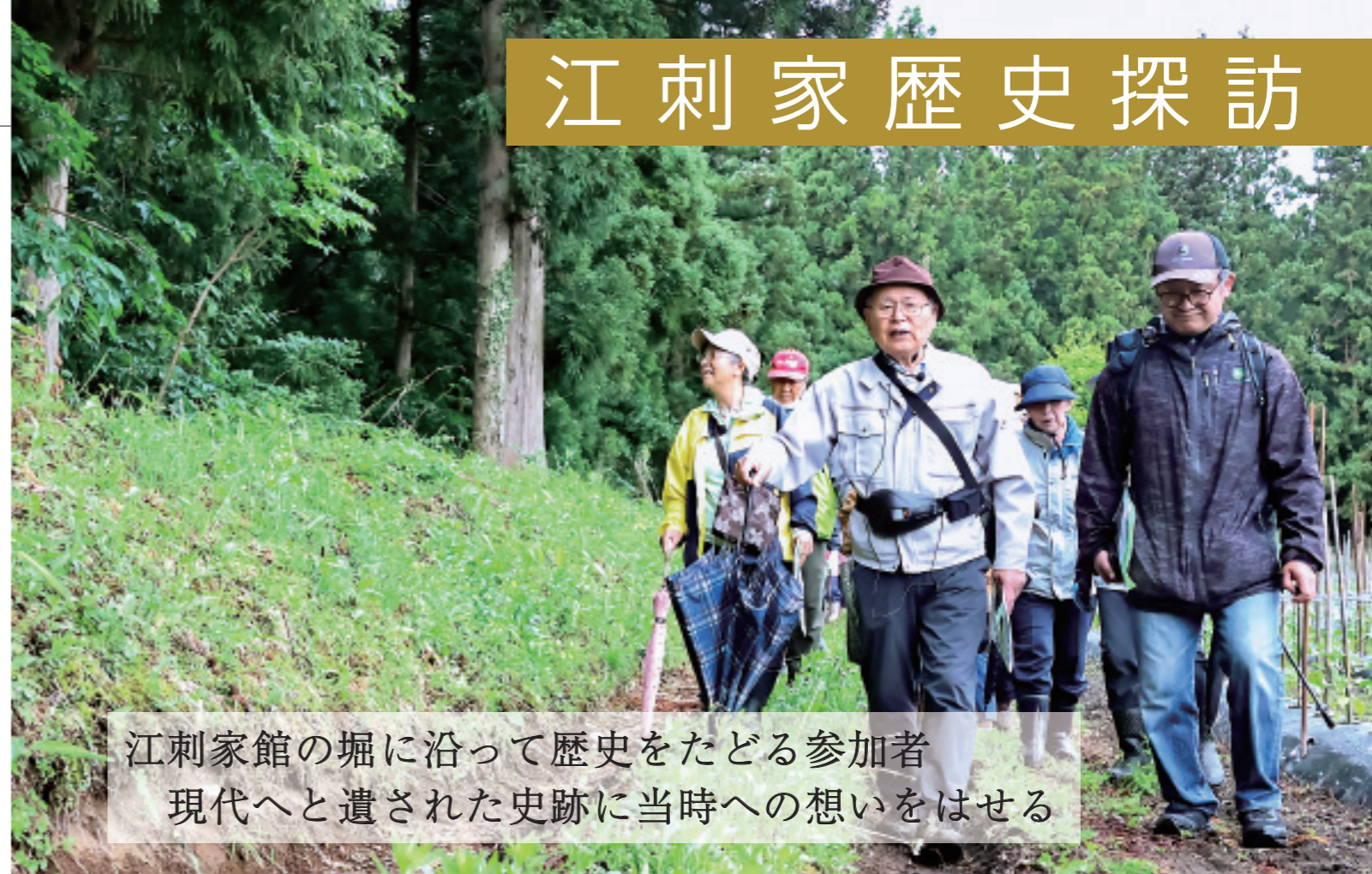
江刺家館の堀に沿って歴史をたどる参加者 現代へと遺された史跡に当時への想いをはせる

6月6日、江刺家地区で「江刺家の史跡を見て歩こう」と題した史跡散策イベントが行われ、30人が参加しました。