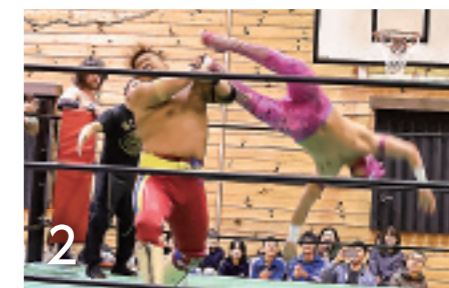
1_ 世代問わず楽しめました 2_ 迫力満点の試合が繰り広げられました

6月5日、アジアンプロレスリングが主催するチャリティープロレス in 九戸が村体育センターで開催されました。