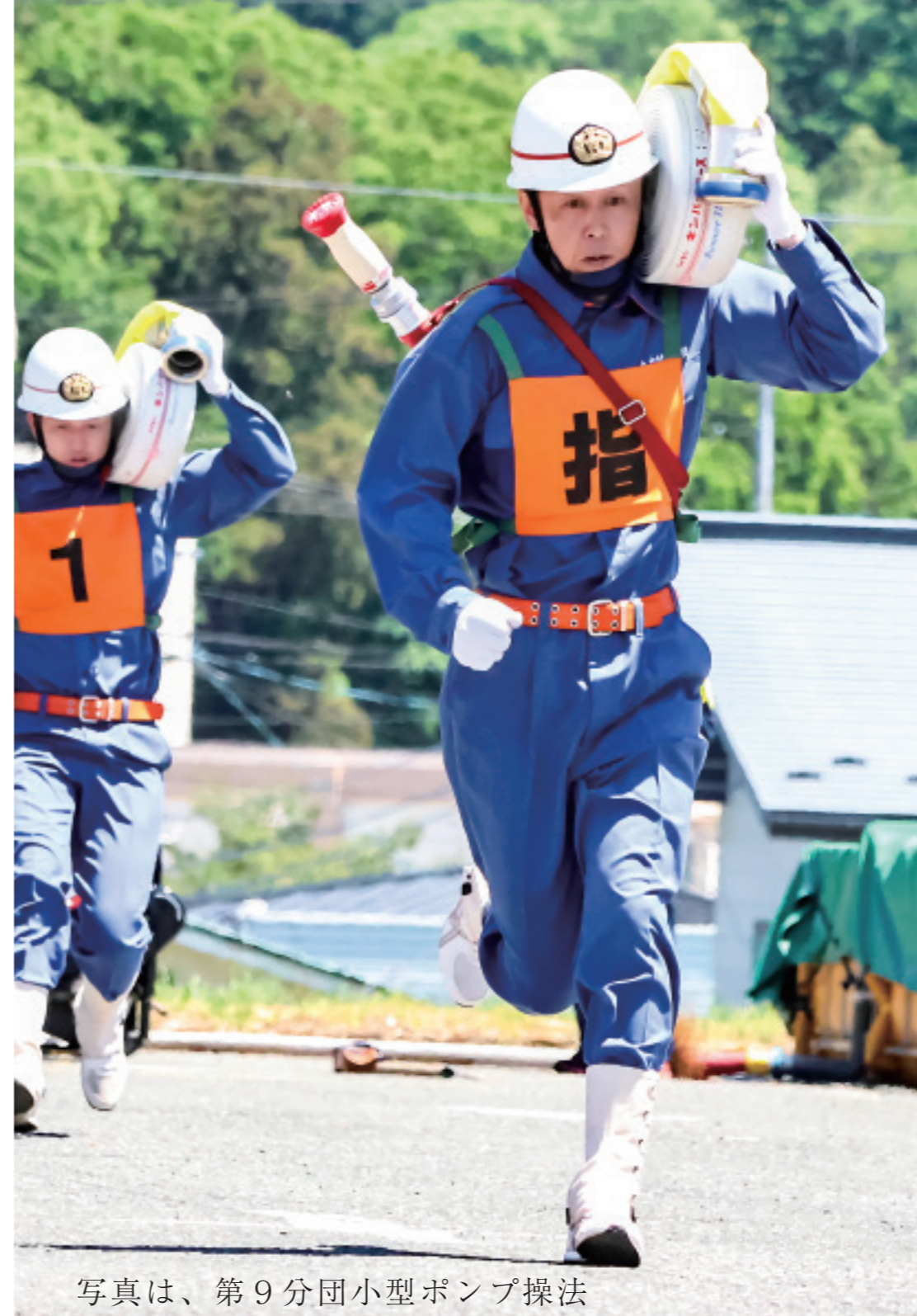
写真は、第9分団小型ポンプ操法

5月31日、村体育センター駐車場で第57回九戸村消防団ポンプ操法競技会が開催されました。競技はポンプ車の部と小型ポンプの部に分かれて行われ、「土気、規律」「迅速な行動、動作、チームワーク」「確実な操作」「消防用機械器具の精通とその愛護」「各隊員の安全」を要点に審査されました。